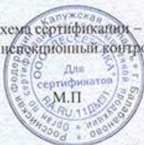
Схема сертификации – Ic(m). Инспекционный контроль – март 2022 года, март 2023 года.